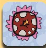
Upple roja con manchas grises