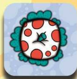
White apple with red spots