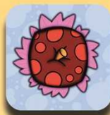
Red apple with red spots

Special apples: There are 4 types, each with different properties. They affect all komupples equally: