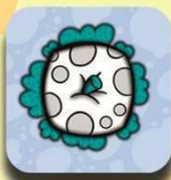
Upple blanca con manchas grises

Upples clásicas: Existen cuatro tipos, blancas con manchas grises, blancas con manchas rojas, rojas con manchas grises y rojas con manchas rojas. Las blancas solo pueden ser comidas por komupples blancos (cuerpo blanco, independientemente de su color de pelo), y las rojas solo pueden ser comidas por komupples rojos (cuerpo rojo, independientemente de su color de pelo). No otorgan salto extra, y por tanto el turno se termina cuando son comidas.